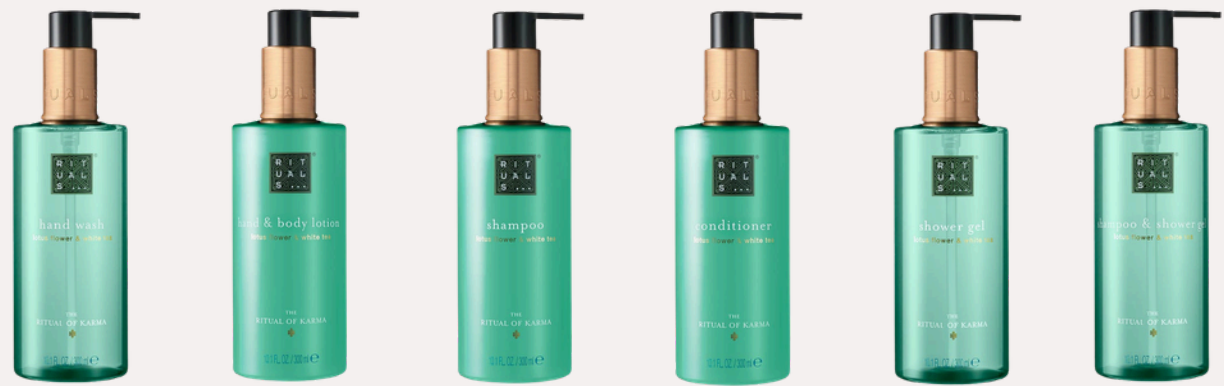
HAND WASH 300 ml HAND & BODY LOTION 300 ml SHAMPOO 300 ml CONDITIONER 300 ml SHOWER GEL 300 ml SHAMPOO & SHOWER GEL 300 ml