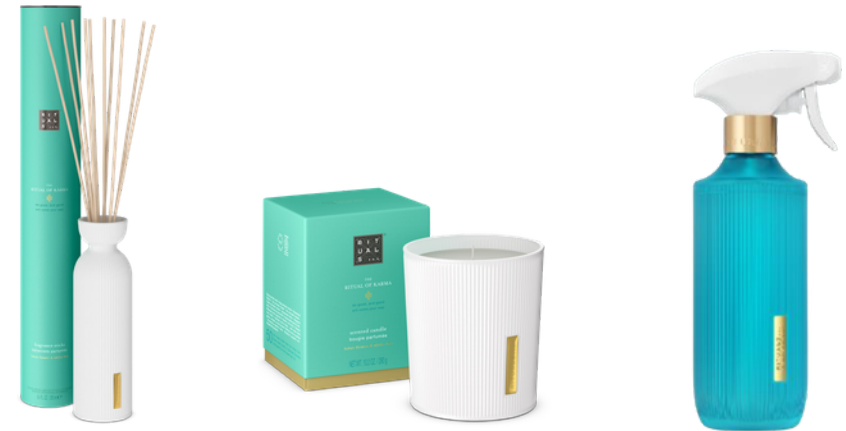
FRAGRANCE STICKS SCENTED CANDLE HOME PERFUME